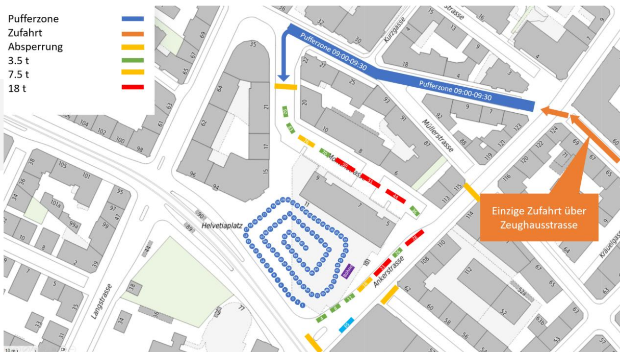
Abbildung 1: Startaufstellung Fahrzeuge

An dieser Stelle möchten wir nochmals erwähnen, dass die einzige Zufahrt für Fahrzeuge über die Zeughausstrasse führt.